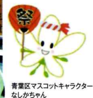
青葉区マスコットキャラクター なしかちゃん