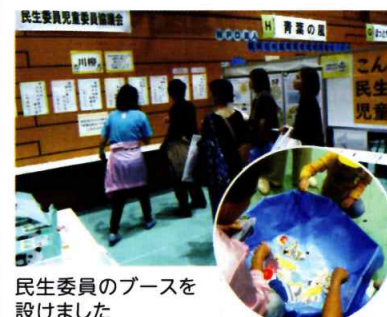
民生委員のブースを設けました