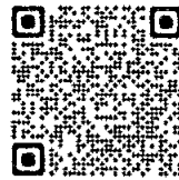
よこはま防災 e-パーク 二次元コード

70本以上の動画やミニテストなど、充実したデジタル教材を揃え、火災、救急、地震、風水害など、いざという時に備える幅広い防災の知識を学ぶことができるウェブサイトです。